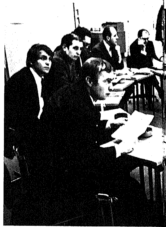
Quickborner Entscheider-Training in Bonn:

Den Widerstand der Kundenchargen, die mit dem Einzelzimmer ihr Prestige gefährdet sahen, kanalisieren die Schnelle-Brüder in betriebliche Planungskollektive, in denen die Berater präsidieren und die Beplanteten mitreden durften. In Quickborner Terminologie heißt das: »Wir treten nicht