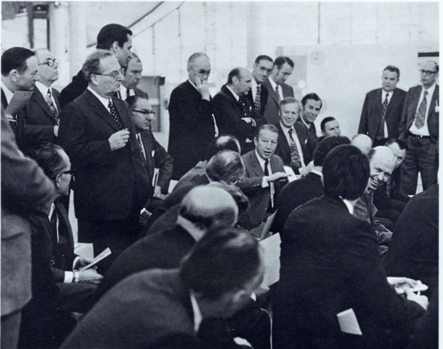
Die Spontan-Diskussion - ob im Themenstand, im Anschluß an die Einführung, ob im Spontanstand unmittelbar - wird als eine wesentliche Hilfe der Meinungsbildung eingeschätzt (Besucherresonanz). Ihr Kennzeichen: kurze Beiträge, Gesprächsführung durch die Teilnehmer; hier Besucher vom Stand 6.

Dieses Urteil sollte bei der Organisation der nächsten Tagung berücksichtigt werden.